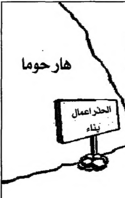
هار حوما (مترجم)

له كما تقرر مخبراته بان نتنياهو يتولى اعطاء الفلسطينيين 48 بالمئة من مساحة الضفة فقط فانه سيخمد المفاوضات ويتحول الى مرحلة أكثر عنفا من جر الدول العربية نحو الواجهة النشطة ضد اسرائيل.